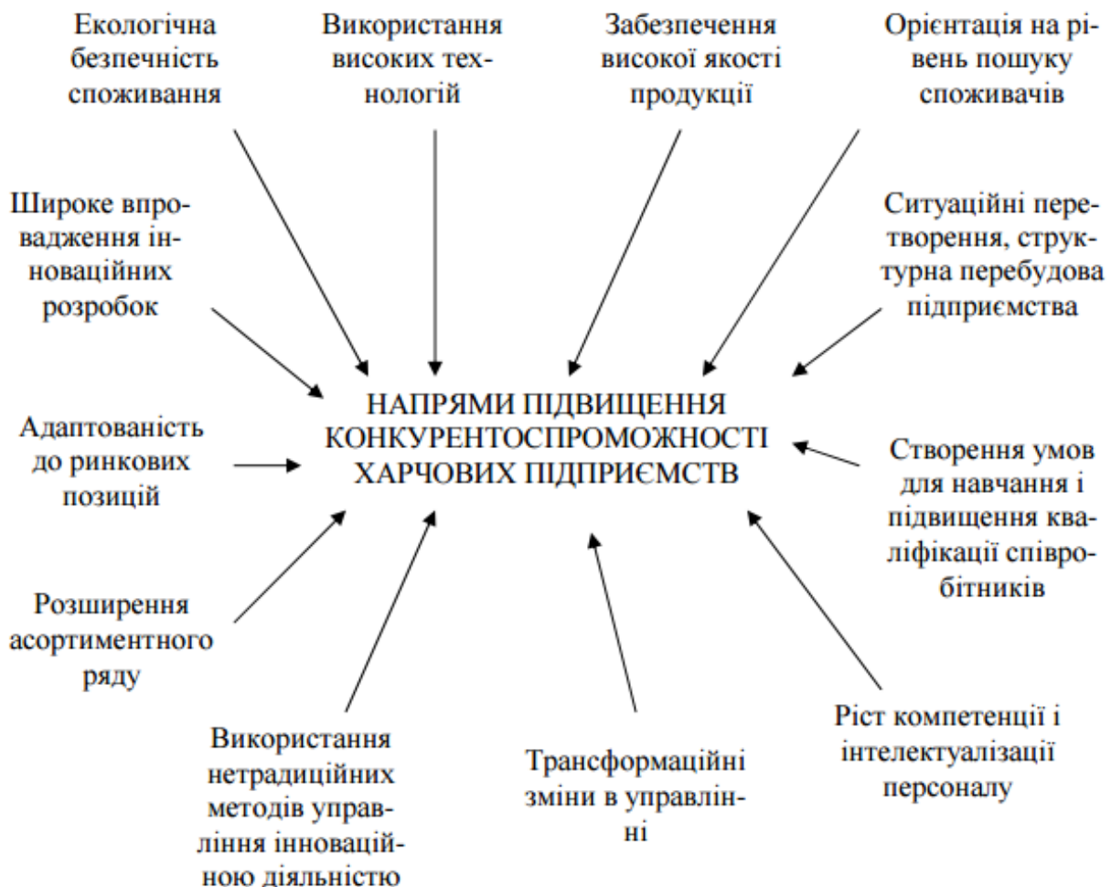
Рис. 2. Шляхи та напрями підвищення конкурентоспроможності підприємств харчової промисловості

Фахівці [6] виділяють наступні напрямки підвищення конкурентоспроможності харчових підприємств (рис. 2).