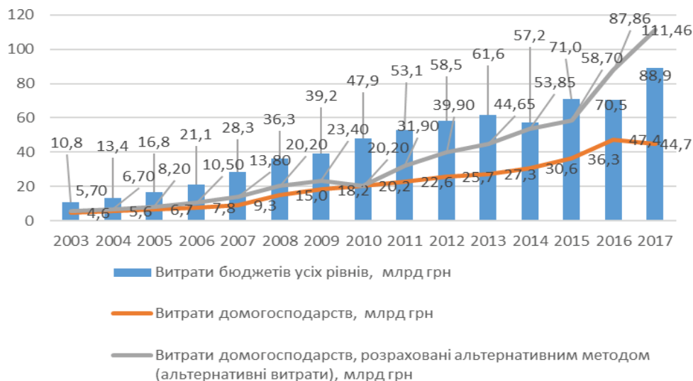
Рис. 1. Витрати домогосподарств та держави на охорону здоров'я за 2003-2017 рр. (млрд. грн)

Водночас, починаючи із 2016 р. спостерігається тенденція до розбіжності між трендами прямих та альтернативних витрат домогосподарства на охорону здоров'я. Як видно із рис. 1. обсяг альтернативних витрат, розрахованих як різниця між доходами та заощадженнями, у 2016-2017 рр. має чітку тенденцію до зростання. Хоча, згідно до заяв МОЗ України, рівень здоров'я нації за цей період не зазнав жодних змін, однак, частка витрат на охорону здоров'я зросла з 3,7% до 4,2% від загальних витрат домогосподарства та, відповідно до проведеного статистичного прогнозування, має тенденцію до подальшого зростання. Проаналізувавши темпи зростання вартості медичних препаратів та темпи приросту середньої заробітної плати, представлені на рис. 1, ми визначили, що лише 0,09% приросту можна пояснити зростанням цін на фармацевтичні препарати та послуги (також вплив фактору зростання цін на медичні препарати відображено при статистичному прогнозуванні ПРЕДСКАЗ.ETS на 2017 р. та оцінено як +0,071% від загальної суми витрат домогосподарств), тоді як 0,41% зростання припадає на зниження рівня довіри населення до системи охорони здоров'я, що пов'язано із реформуванням цієї системи. Відповідно до досліджень статистичної агенції